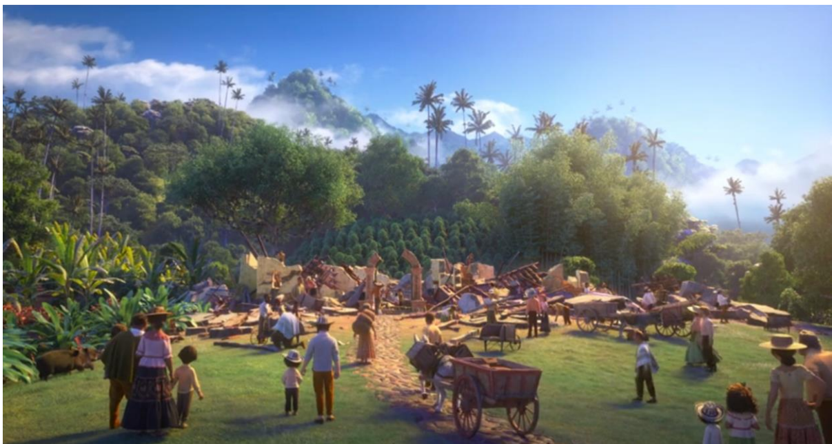
Encanto (2021). La casita Madrigal siendo reconstruida con la ayuda de todo el pueblo.

Bruno regresa a la familia solo cuando se reconoce su verdadero valor, lo que sugiere que el verdadero hogar no es un espacio físico, sino un estado de aceptación y conexión con los demás. Eliade (2003) sostiene que la sociedad debe aprender a integrar y valorar las visiones de aquellos que ven más allá, ya que son estas percepciones las que pueden ofrecerles guía y sanación. La restauración de la casa Madrigal simboliza, así, la reconciliación entre lo individual y lo colectivo, permitiendo la reconstrucción de un espacio donde la autenticidad y la aceptación son la verdadera fuente de equilibrio.