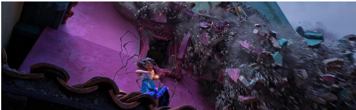
Encanto (2021). La casita Madrigal colapsando.

La arquitectura se utiliza como una manifestación visual de las conexiones emocionales e identitarias de los personajes. Cuando estas estructuras colapsan, la crisis es inevitable, pero también necesaria para el crecimiento. Estos colapsos reflejan el ciclo de muerte y renacimiento, donde la crisis se convierte en una oportunidad para una conexión más profunda con uno mismo y con los demás. Desde esta perspectiva, el derrumbe es un ritual de transición. Tanto Bruno como Riley atraviesan procesos de desprendimiento de lo viejo para poder abrirse a nuevas formas de ser. En ambos casos, la destrucción es solo el primer paso hacia una conexión más auténtica, reafirmando la idea de que solo al dejar ir el apego a lo conocido podemos evolucionar.