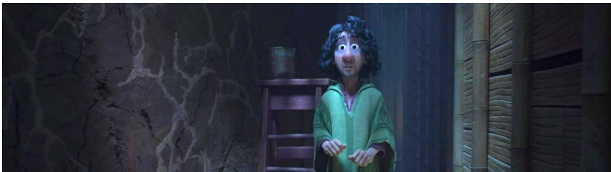
Encanto (2021). Bruno al lado de las grietas de la pared de la casa Madrigal.

En Encanto , las grietas en la Casa Madrigal aparecen como un reflejo del estrés acumulado dentro de la familia, particularmente en relación con Bruno y la presión que cada miembro experimenta debido a su "don". En Frozen , el Palacio de Hielo de Elsa cumple una función similar: su estructura se forma a partir de su poder cuando finalmente se libera del miedo y la represión, pero comienza a fracturarse cuando experimenta angustia, especialmente al sentirse responsable del peligro que enfrenta su hermana. Ambos personajes muestran patrones psicológicos asociados con el aislamiento social y la disociación emocional.