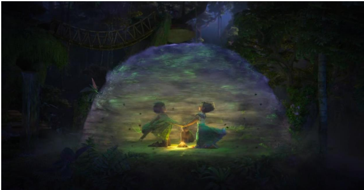
Encanto (2021). Bruno en estado de trance de la mano de Mirabel.

Los momentos de trance pueden considerarse como estados de liminalidad psíquica, en los cuales Bruno se encuentra suspendido entre diferentes realidades, entre lo que podría ser y lo que realmente es. Este estado de consciencia alterada parece estar simbolizado por las grietas que penetran su subconsciente, representando la fractura temporal en su percepción y su comprensión de los eventos que le rodean.