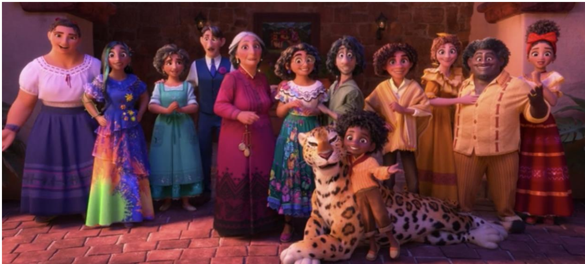
Encanto (2021). Retrato final.

Finalmente, las grietas en la casa son tanto heridas como umbrales: marcas de la fragmentación, pero también signos de una transformación latente. Porque en Encanto , la crisis es el preludio de una reconstrucción más auténtica, donde la armonía se encuentra en la integración de todas nuestras luces y sombras.