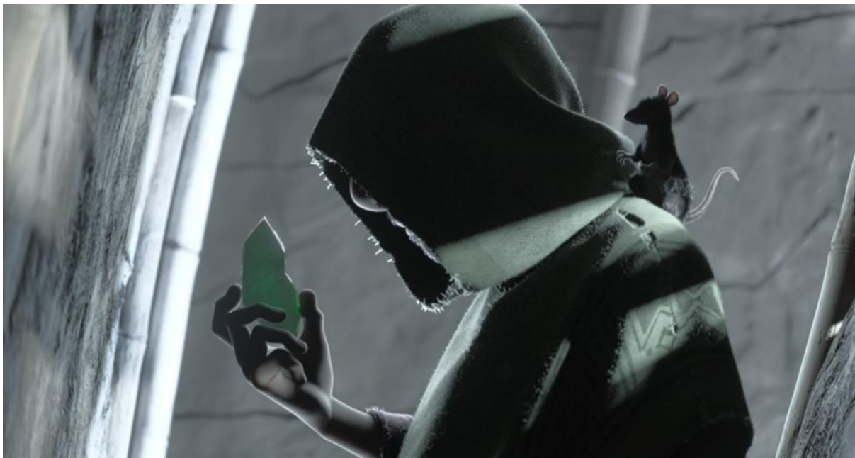
Encanto (2021). Bruno en el espacio intersticial de la casa Madrigal.

Las grietas asociadas a Bruno comparten su estética lúgubre y oscura. Este uso diferenciado del color responde a lo que Itten (1973) denomina "armonías subjetivas", en las que los colores transmiten estados emocionales y su relación con el entorno. De esta manera, la paleta cromática refuerza la sensación de que Bruno, al igual que las grietas, representa una parte de la familia que ha sido reprimida y relegada.