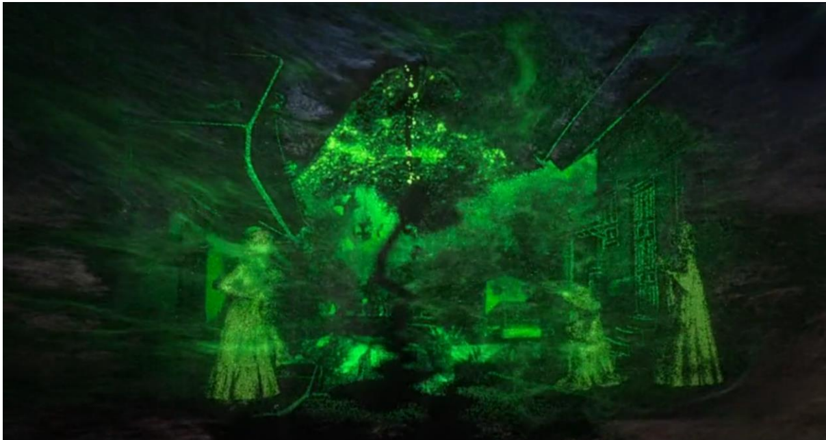
Encanto (2021). Traumática visión de Bruno representando una grieta que recorre todo el pueblo.

Además, la ansiedad y el nerviosismo que caracterizan a Bruno reflejan un estado de hiperactivación del sistema nervioso simpático, lo que dificulta su capacidad de adaptación y regulación emocional. Al refugiarse en el autoexilio, intenta protegerse de un entorno que percibe como hostil. Desde esta perspectiva, las grietas en la casa simbolizan las fracturas invisibles que el estrés crónico y el trauma dejan en la psique de una persona. Así como el equilibrio homeostático del organismo se ve alterado por la exposición prolongada al estrés (Sapolsky, 2015), la estructura de la casa Madrigal se debilita bajo la presión de la rigidez familiar, evidenciando la necesidad de transformación y sanación.