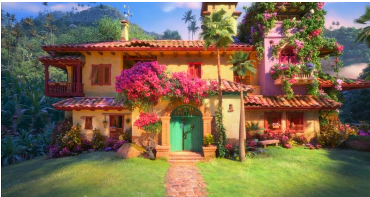
Encanto (2021). La casa Madrigal.

Como señala Bachelard (1965) en La poética del espacio , la casa no es solo un espacio físico, sino también una representación simbólica de la psique de quienes la habitan. Las modificaciones en su estructura, incluidas las grietas, pueden interpretarse como expresiones de tensiones emocionales no resueltas. En este sentido, las grietas en la Casa Madrigal son la manifestación material del conflicto familiar, especialmente en relación con Bruno, quien encarna la figura más marginada del hogar. El concepto de la "casa onírica" que plantea Bachelard resuena con la Casa Madrigal, donde cada habitación refleja el mundo interior de sus habitantes, mientras que las grietas simbolizan las fracturas emocionales latentes en la familia.