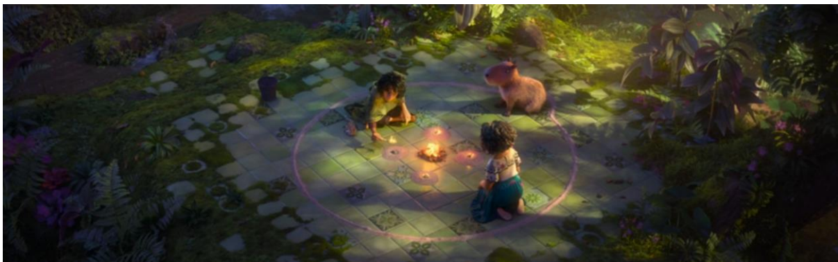
Encanto (2021). Bruno efectuando el ritual previo al trance.

Tanto en Encanto como en Soul , la postura sentada y el estado de concentración profunda permiten a los protagonistas trascender la realidad inmediata y acceder a una comprensión más profunda de sí mismos. Mientras que Bruno entra en un trance visionario que le permite ver el futuro en fragmentos simbólicos, Joe alcanza un estado meditativo que le permite reconectar con su propio cuerpo en la Tierra. Ambas escenas representan, desde un enfoque neurocientífico, cómo los estados de introspección pueden alterar la percepción del tiempo y el espacio, funcionando como portales hacia el subconsciente y la autoconciencia.