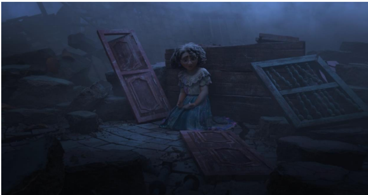
Encanto (2021). Mirabel entre los escombros de la casa Madrigal derruida.

El colapso de la casa simboliza una crisis existencial, un momento en el que las estructuras de significado se desmoronan y es necesario un proceso de reconstrucción interna. Este proceso es análogo al camino de individuación descrito por Jung (1953), donde la integración de los aspectos rechazados del yo permite alcanzar una mayor plenitud. Bruno, como figura marginada, encarna el arquetipo del sabio incomprendido, aquel que se aleja de la sociedad para comprender verdades más profundas. Sin embargo, su retorno solo es posible cuando el colectivo está listo para aceptarlo, en un proceso de transformación y reconciliación colectiva. En este sentido, su papel se asemeja a la figura del chamán descrita por Eliade (2003), un mediador entre los mundos que requiere un aislamiento necesario antes de regresar con conocimientos que pueden sanar a la comunidad.