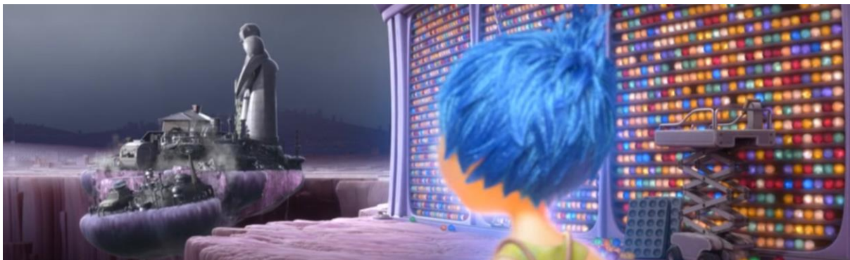
Inside Out (2015). Isla de la familia colapsando.