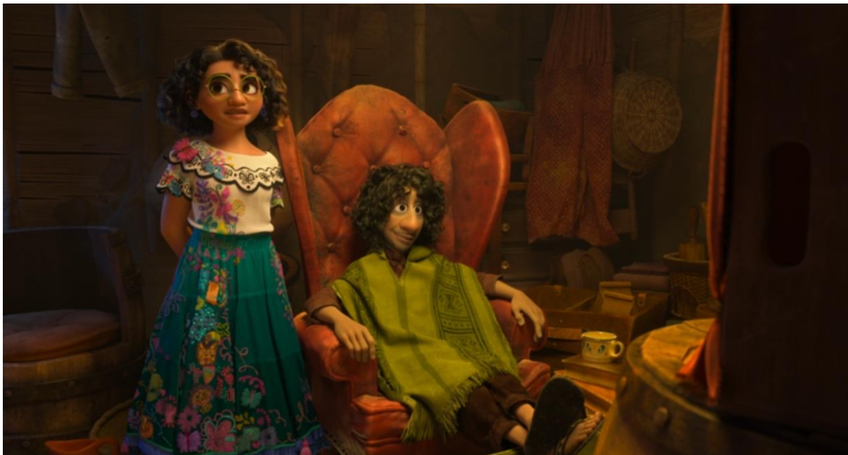
Encanto (2021). Mirabel en el escondite de Bruno.

Las grietas en la casa Madrigal pueden interpretarse como una representación simbólica de la distancia entre Bruno y su familia, quienes, presionados por la matriarca, buscan mantener una ilusoria perfección. En términos de psicología social, el rechazo sistemático y la estigmatización pueden llevar a un individuo a desarrollar un autoconcepto negativo, afectando su bienestar psicológico y su integración en la comunidad (Goffman, 1963).