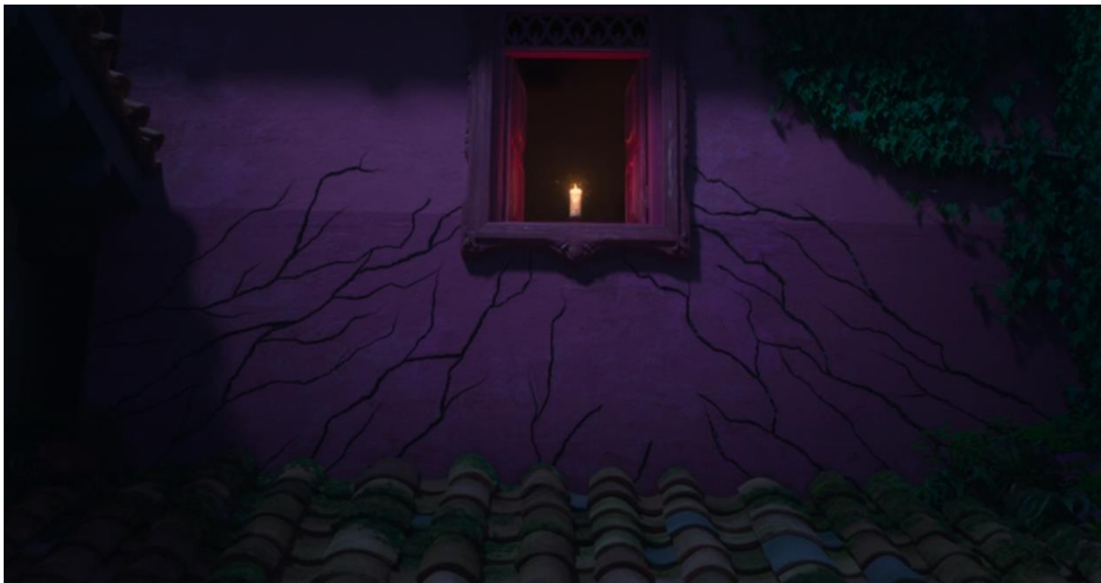
Encanto (2021). Grietas en el corazón de la casa Madrigal.

Las grietas en la casa Madrigal pueden entenderse, desde esta perspectiva, como una manifestación simbólica de la sobrecarga emocional y sensorial que experimenta Bruno. Así como una persona altamente sensible puede alcanzar un estado de colapso bajo una carga emocional excesiva, la casa responde con fracturas cuando la presión emocional dentro de la familia se intensifica. Esta interpretación se alinea con la visión de Damasio (1999) sobre la interconexión entre emociones y procesos fisiológicos, según la cual el estrés emocional no solo afecta la mente, sino que también puede tener consecuencias visibles en el entorno y en el cuerpo.