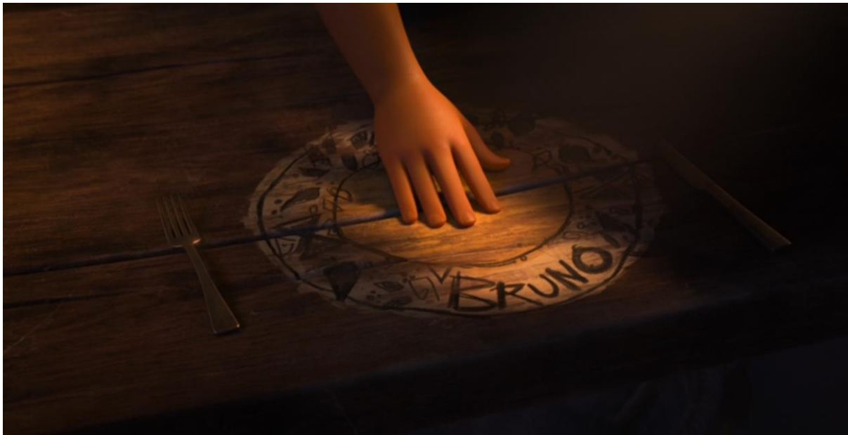
Encanto (2021). Plato autodibujado por Bruno.

Estos rasgos sugieren que Bruno ha desarrollado mecanismos de afrontamiento para lidiar con su exclusión, aunque estos mismos mecanismos refuercen su aislamiento y su sensación de desconexión. Su ausencia física se traduce en una grieta latente que nadie quiere reconocer, pero que amenaza la estabilidad de la familia. Esta representación simbólica se alinea con la teoría de los sistemas familiares de Minuchin (1974), quien plantea que los conflictos no resueltos pueden manifestarse en dinámicas disfuncionales que afectan la estructura de todo el sistema.