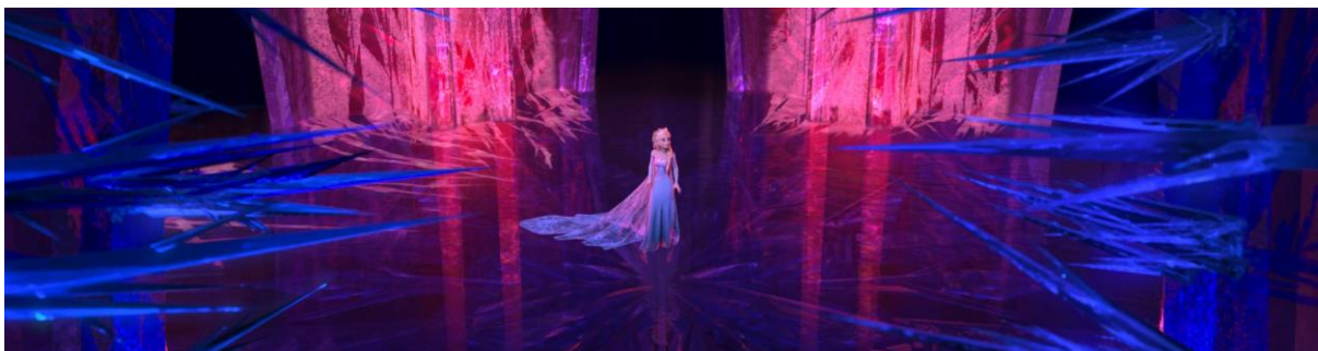
Frozen (2013). Elsa en su palacio cuando empiezan a vislumbrarse las grietas.