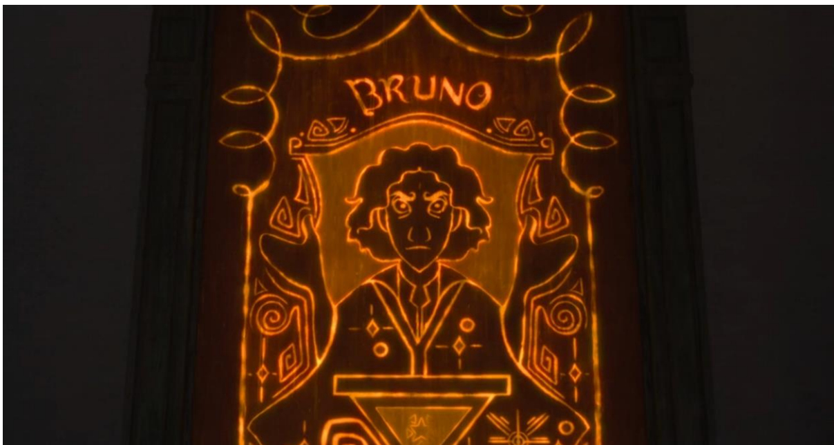
Encanto (2021). La puerta de la habitación de Bruno brillando por la activación de su magia.

Benjamin argumenta que el aura se manifiesta en la imposibilidad de acceder de manera inmediata a un significado único. En el caso de la profecía de Bruno, esta se presenta como un misterio: su interpretación depende del observador y está desligada de una verdad absoluta. Esta ambigüedad refuerza la figura de Bruno como un personaje místico y enigmático, cuya percepción del mundo se acerca a una sensibilidad neurodivergente.