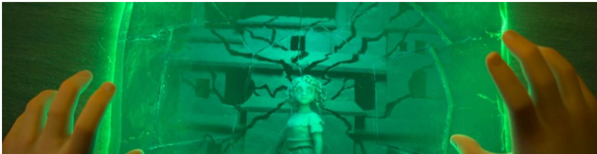
Encanto (2021). Visión de Bruno fracturada.

La fragmentación en ambos filmes es un recurso visual que enfatiza la naturaleza incierta del conocimiento y la identidad. Tanto Bruno como Ian deben navegar la incertidumbre y reconstruir lo que está roto para comprender su verdadero propósito. Así, la estética de la fragmentación invita al espectador a reflexionar sobre el valor de la incompletitud y la posibilidad de transformación.