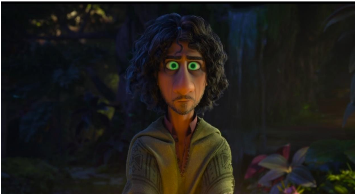
Encanto (2021). Bruno con los ojos fluorescentes representando su magia.

Desde esta perspectiva, las grietas en la casa Madrigal pueden interpretarse como una manifestación visual del colapso emocional y neurológico que experimenta Bruno. De manera análoga a cómo los cerebros neurodivergentes pueden alcanzar un punto de saturación ante un entorno hostil o excesivamente demandante, la estructura de la casa refleja el impacto del estrés psicológico acumulado dentro de la familia.